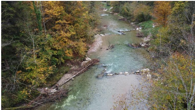
Strukturriegel in der Töss (ZH) mit ergänzenden ingenieurbio- logischen Massnahmen (IUB Engineering AG)

Dienstag, 13. Mai 2025 Mardi, 13 mai 2025