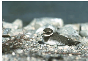
Grand Gravelot sur l'île aux oiseaux de Préverenges rapport final (2003)

Valorisation des rives lacustres - Etat des lieux Mardi, 7 juin 2016 – Musée des transports, Lucerne