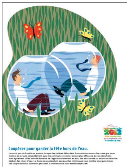
Figure 3: Annonce représentative de la campagne de sensibilisation menée dans le cadre de l'année internationale de la coopération dans le domaine de l'eau (Illustration de Anna Sommer)

«institutionnalisée». C'est pour cette raison, ainsi que l'occasion offerte par l'Année internationale de la coopération dans le domaine de l'eau ( www.eau2013.ch ), que l'OFEV a lancé l'élaboration du «Guide de coopération eau pour les communes» 6 .